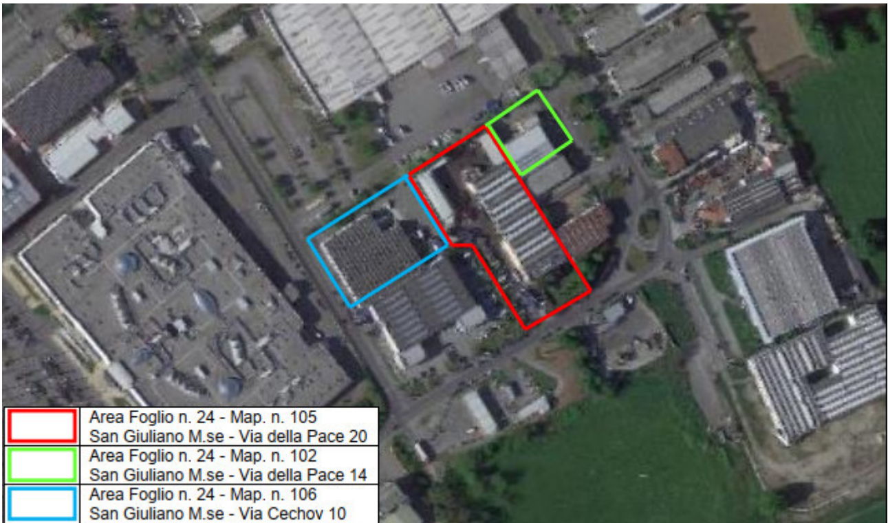
Figura 1. Ortofoto complesso IPPC